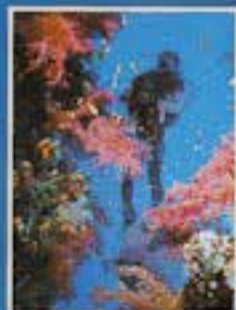
Portada de la guía del sur del Mar Rojo realizada por Ricard Buxó.

estas islas y cuya obertura en forma de reserva natural aún nadie conoce".